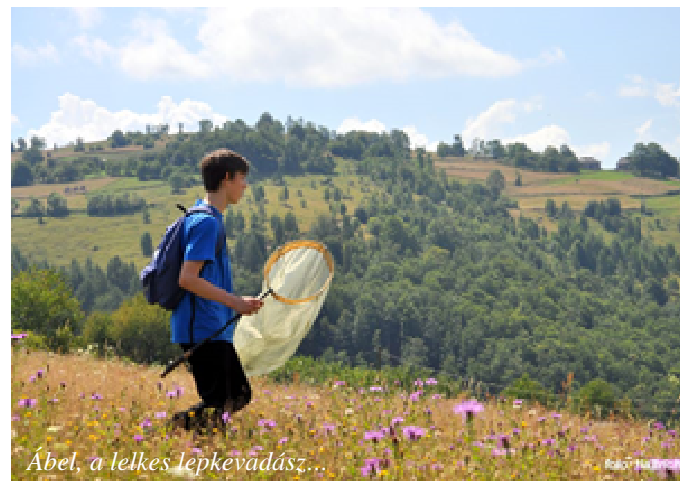
Ábel, a lelkes lepkevadász...

Már tavasszal voltak olyan hangok, hogy „esős nyarunk lesz”, de