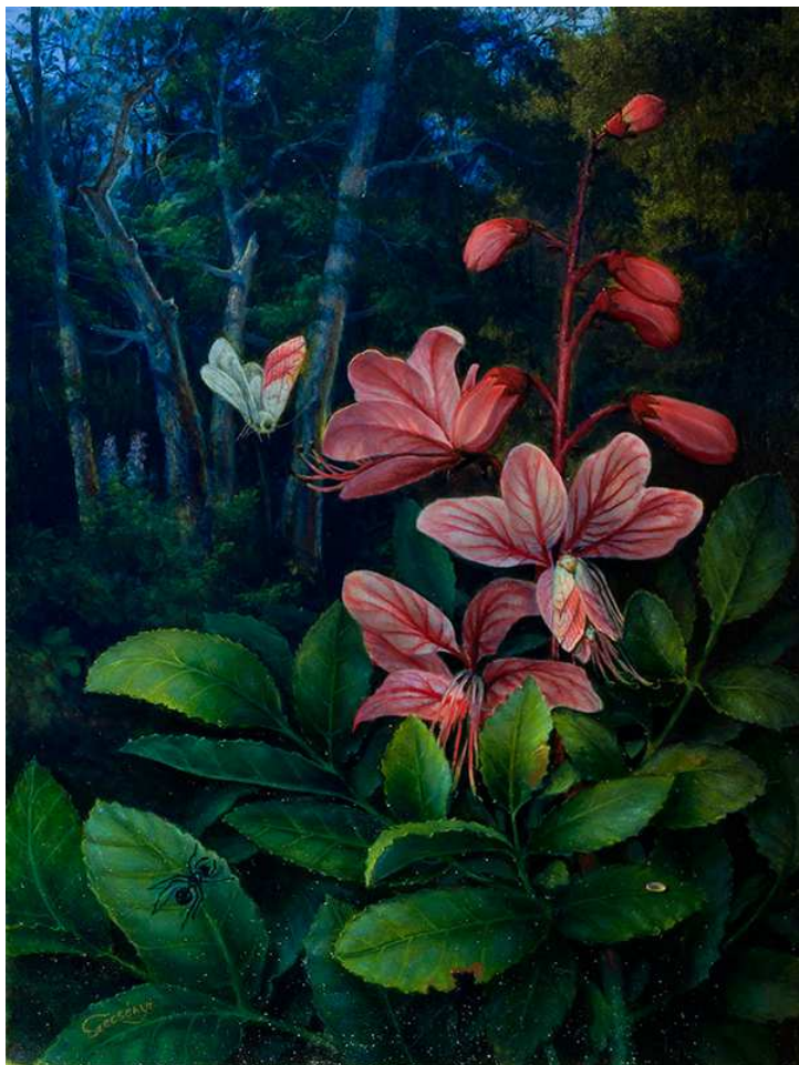
Szécsényi Lajos: Este (18x24 cm, olaj)