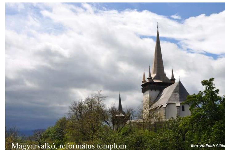
Magyarvalkó, református templom