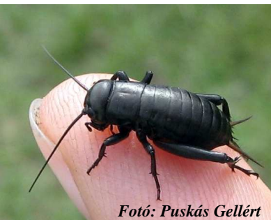
Fotó: Puskás Gellért

http://index.hu/nagykep/2016/03/03/ferfias_thai_box_cuki_kis_csapokkal/