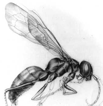
Nagy útonállódarázs ( Priocnemis vulgaris, Dufour, 1841)