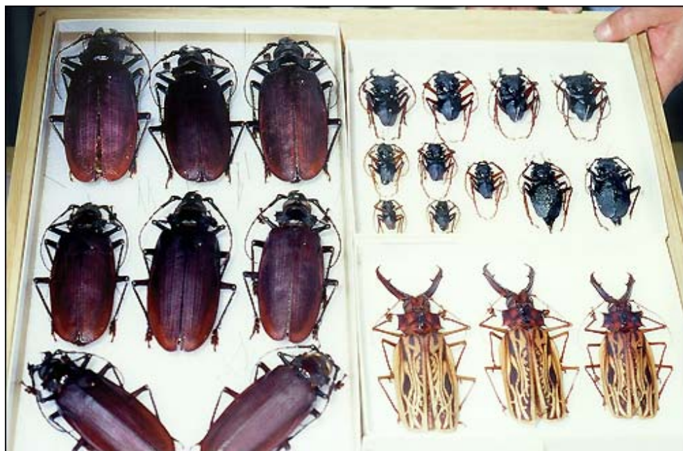
A sydneyi Macleay Museum 16,3 cm-es óriáscincére ( Titanus giganteus ). Hosszú ideig ez volt a "legnagyobb" bogár.