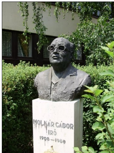
Molnár Gábor mellszobra a róla elnevezett ajkai iskola előtt